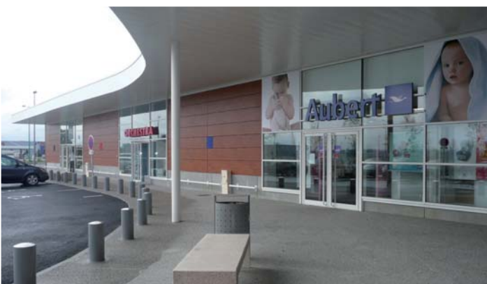
LA TREMBLAYE - Agneaux, Saint-Lô Architecte : Agence Franc