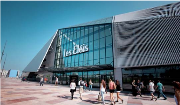
LES ELÉIS - Cherbourg-Octeville Architectes : Arte Charpentier, Calq Architecture