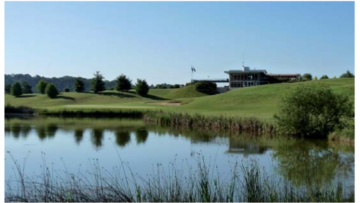
GARDEN GOLF d'Evreux