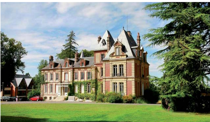
LE CHÂTEAU DE PRÊTEVILLE - Gonnevilleneuve