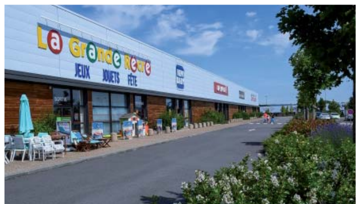
PORTE DE NORMANDIE - Alençon