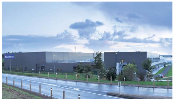
FAURECIA - Caligny Architecte : Cabinet Iida Archship Studio