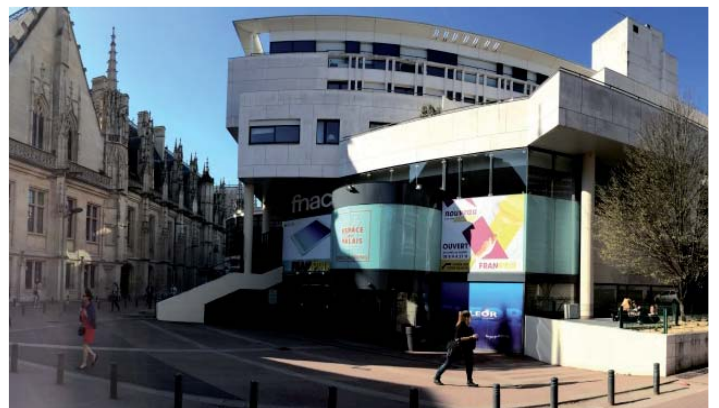
ESPACE DU PALAIS - Rouen Architecte : Pierre Riboulet